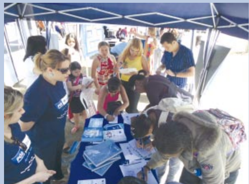
Estande do UBM foi bastante visitado durante a feira

O objetivo da feira foi oferecer ao jovem estudante orientação profissional e vocacional e proporcionar o contato deles com diversas profissões, informando-os sobre os cursos e oportunidades de trabalho da região. Durante a feira foram realizadas também palestras e atrações culturais como, apresentações de bandas do Sul Fluminense e grupos de dança.