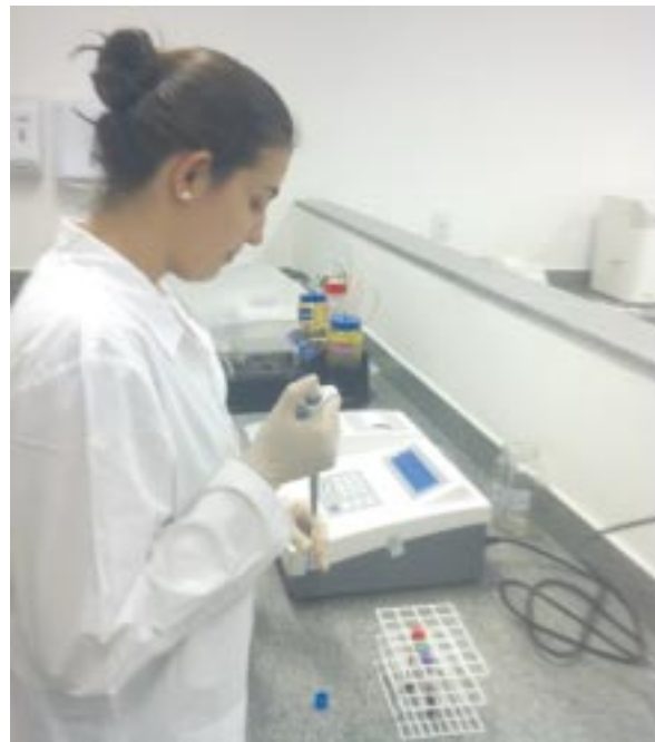
Aluna do curso de Farmácia efetuando procedimento técnico no Laboratório

Os serviços oferecidos são exames clínicos nas áreas de