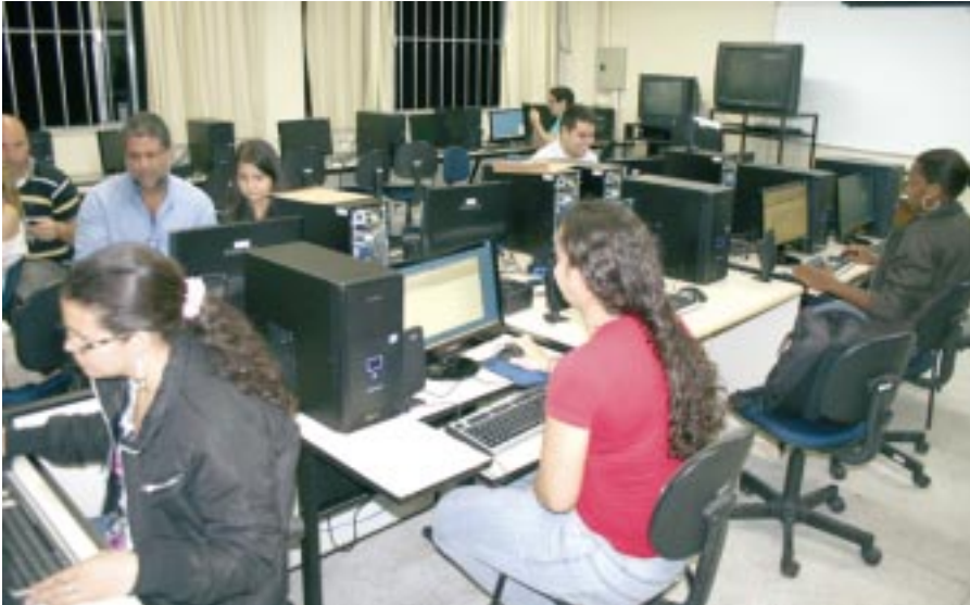
Acadêmicos utilizam os novos computadores

O UBM investiu R$ 1 milhão em melhorias, sendo R$ 800 mil em livros e R$ 200 mil em computadores, no mês de setembro, para os Campi Barra Mansa e Cicuta. A necessidade do