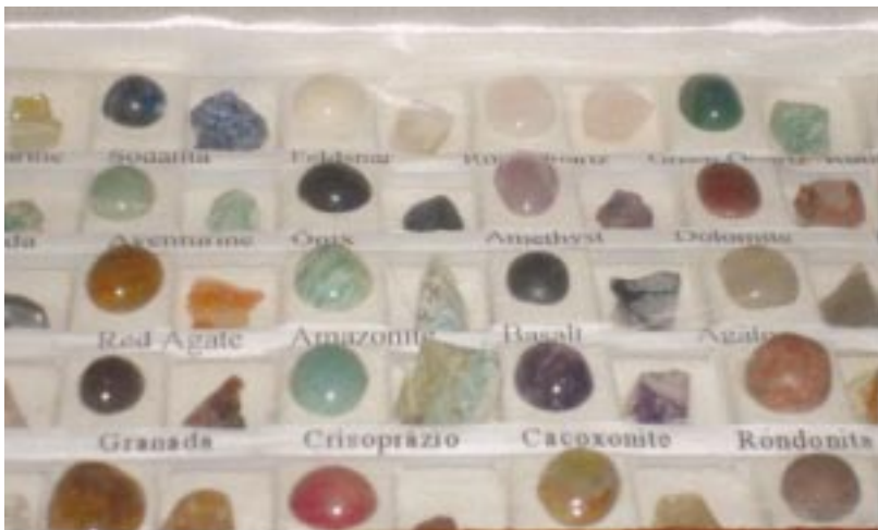
A foto acima ilustra algumas amostras que podem ser doadas

O Laboratório de Geociências tem por objetivo fornecer instalações adequadas à execução de aulas práticas inerentes às disciplinas