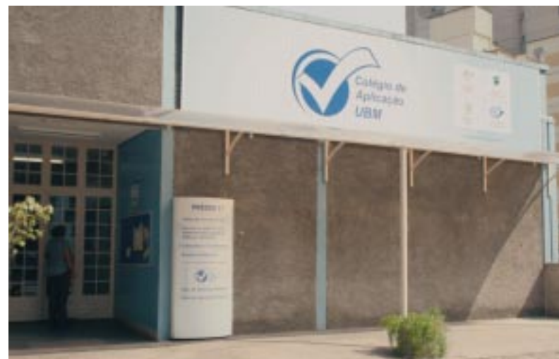
Colégio de Aplicação UBM está localizado no Campus Barra Mansa

De acordo com a diretora, o diferencial do Colégio de Aplicação UBM está em sua proposta pedagógica, que apresenta um currículo arrojado e contextualizado, buscando colaborar com o desenvolvimento dos alunos de maneira integral. Vários projetos são desenvolvidos na escola ao longo da Educação Básica, que se inicia na Educação Infantil, como o Projeto Ler é um Prazer, Campanhas solidárias e de