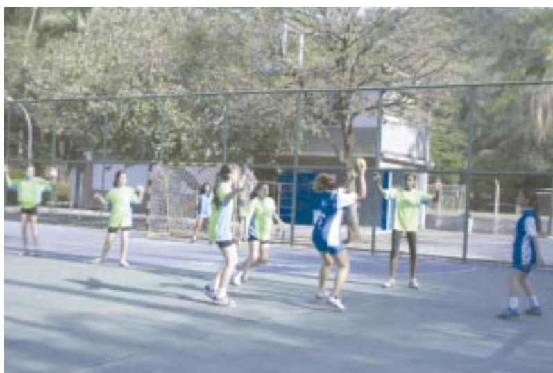
Jogo de Handebol feminino

O Colégio de Aplicação UBM promove, desde o dia 16 de setembro, os Jogos Estudantis do colégio, que têm por finalidade o intercâmbio e a confraternização